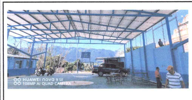
Foto 5: Se requiere el cambio, implementación de cableado y reflectores para iluminación de cancha.