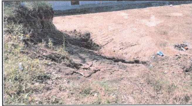
Foto 4: Se requiere la implementacion de gradas para y losa de predio para no ser afectados en tiempo de invierno.