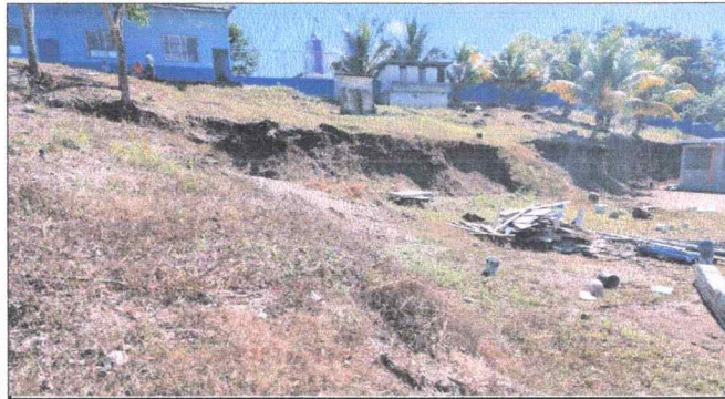
Foto 1: Se observas que dicho predio se necesita impletacion losa para un caminamiento adecuado para que estudiantes sea dirijan a los baños.