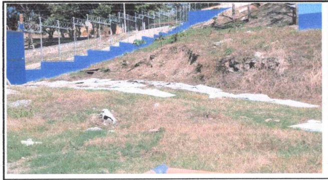
Foto 2: Se observa que se requiere la sutitucion de losa por el deterioro de la misma